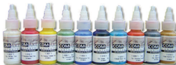
Exemple kit a Opaque Primary