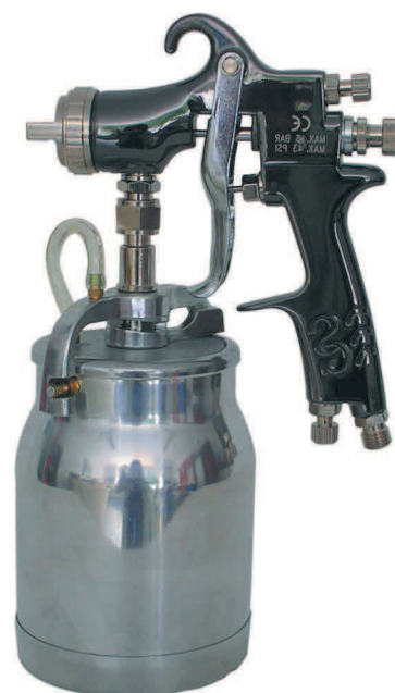
Modèle succion godet 1 litre